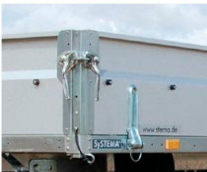
▶ Winkelhebelverschlüsse und breite Scharnierbänder locks and wide hinges

Moving parts are subject to particular wear. This is why we place such a focus on their stability and durability. All STEMA trailers are equipped with robust strag hinges, locks and sturdy lashing eyes. The tipping platform can be fastened additionally with a locking device.