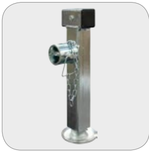
Teleskop-Kurbelstützen telescopic loading stand