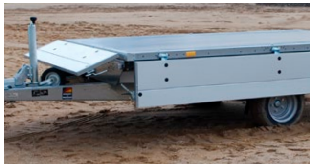
👉 Bordwände allseitig abklappbar side panels can all be folded down