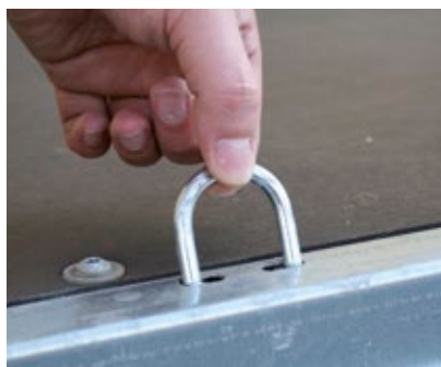
▶ stabile versenkbare Verzurrösen stable towing bar