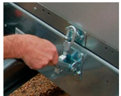
▶ Schließ-Sicherung für Kippbrücke tipper body locking device