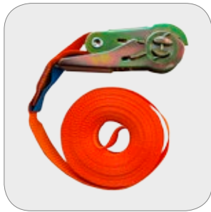
Verzurrigurt lashing straps