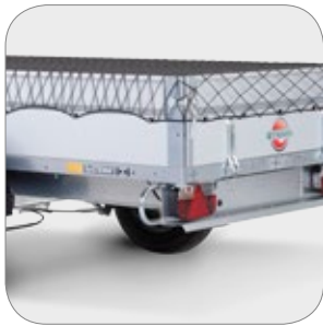
Netz zur Ladungssicherung net for securing cargo