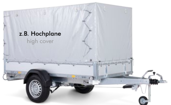
z.B. Hochplane high cover

Practical extensions, as e.g. side panels or high cover make this trailer an allrounder mastering every challenge.