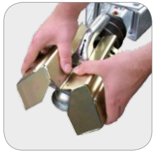
Diebstahlsicherung anti-theft protection

Funktionelle Aufsätze, wie zum Beispiel Bordwand und Hochplane lassen diesen Anhänger zum Allrounder werden der jeden Einsatz meistert.