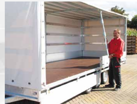
▲ Die Hochplane ist rundum zu öffnen, das Mittelrohr ist herausnehmbar