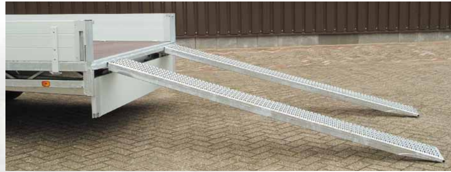
▲ Auffahrampen, 250 cm lang