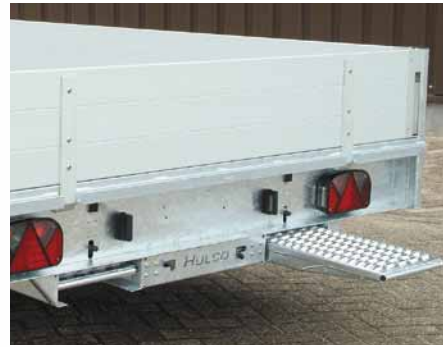
▲ Die Auffahrampen werden in Haltern unter dem Rahmen transportiert