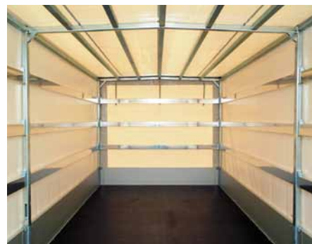
▲ Das Planengestell mit Aluminiumbrettern ist sehr stabil