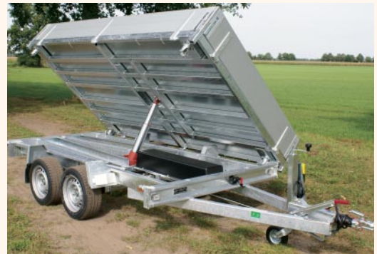
seitwärts kippen (standard)