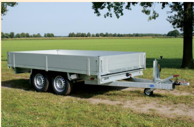
KSX 2000 E