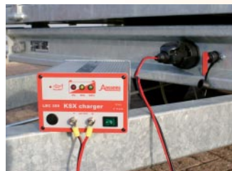
Akkulader (bei elekt. Ausführung)