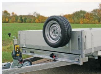
Reserverad mit Halter (Option)