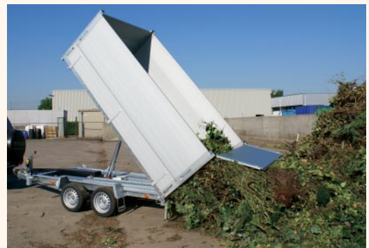
Aufsatzbordwände (einfaches abladen)