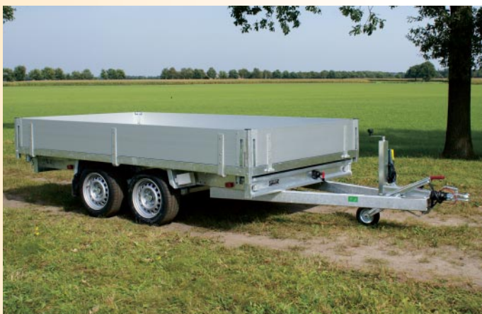
KSX 3000 E

deswegen weist der Anhänger eine sehr stabile Straßenlage auf. Die montierten Achsen und die Auflaufbremse sind von hochwertiger Qualität. Kipper werden häufig schwer beladen, daher entschieden wir uns für eine Bodenplatte aus Stahl von 2,5 cm Dicke. Diese Platte besteht aus einem Teil, so dass keine Nähte vorhanden sind. Die vielen Verstrebungen des Oberrahmens bieten eine gute Stützkraft für die Bodenplatte.