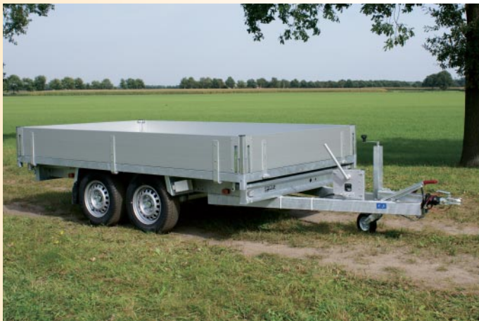
KSX 2000 H

Der Stahlrahmen des Kippers besteht aus zwei Teilen, einem Ober- und einem Unterrahmen. Beide Rahmen werden mit Hilfe eines Roboters geschweißt und vollbadverzinkt. Die V-Deichsel hat eine Länge von 145 cm,