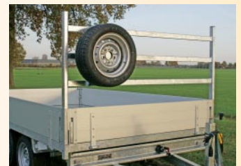
Reserverad mit Halter (Option)