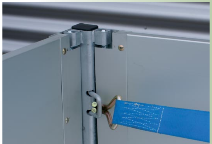
Bindehaken (bei Aufsatzbordwänden)