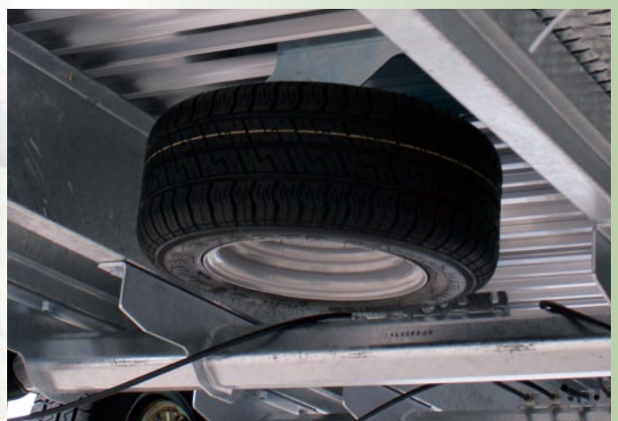
Reserverad mit Halter (Option)