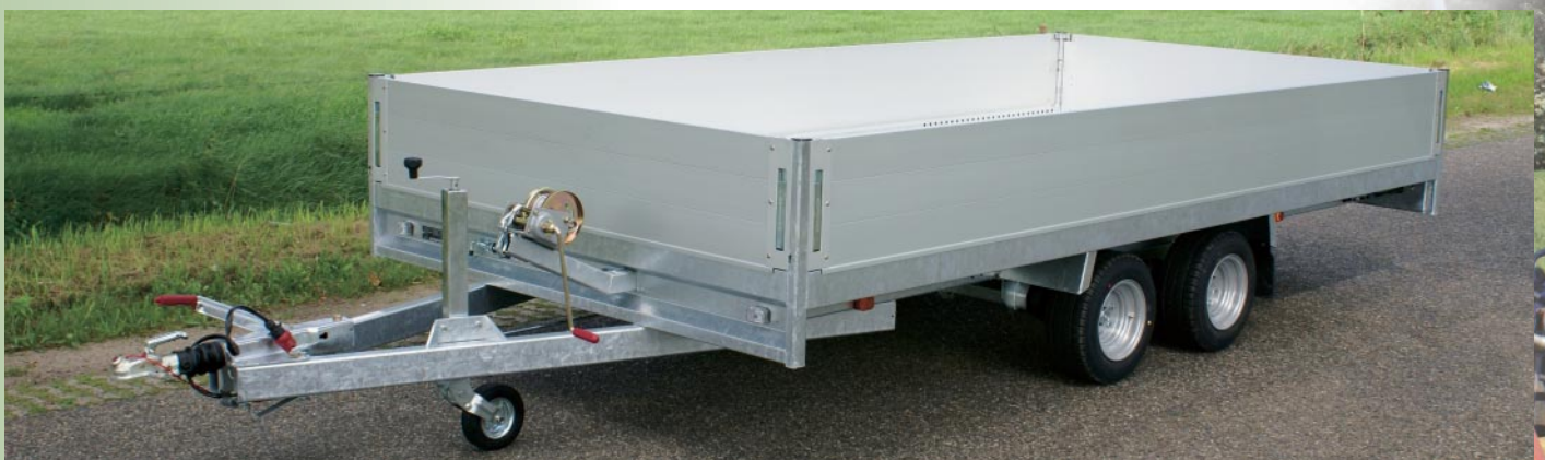
MSX 3000 mit Aufsatzbordwände <Option>